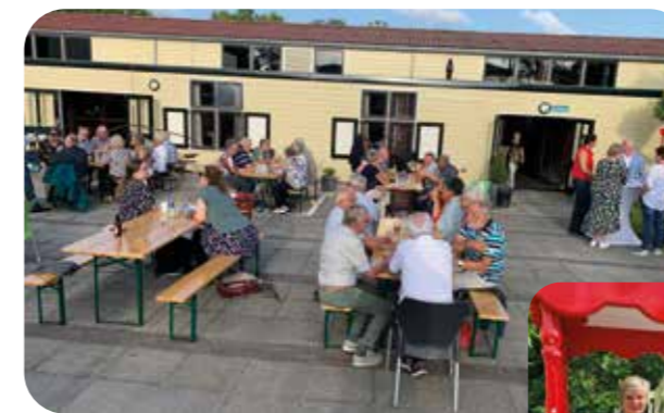
Onderling contact is heel belangrijk. Daarom waren we heel blij dat we dit jaar weer de traditionele vrijwilligers BBQ konden organiseren.