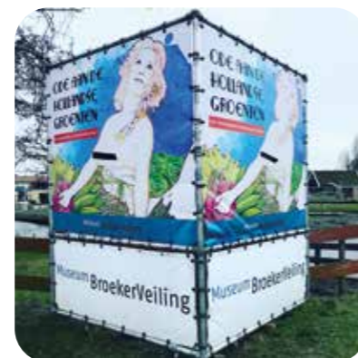
De banner ter promotie van de tentoonstelling (linksboven) en hiernaast de aanpassing die een onbekende deed. Zoveel mensen, zoveel wensen. Het leverde in ieder geval wat extra aandacht op voor de tentoonstelling.