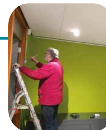
Ook de winkel werd voorzien van een fris laagje verf.