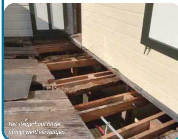
Het steigerhout bij de afmijn werd vervangen.

Het hout van de steiger bij het afmijnlokaal was hard aan vervanging toe. Ook hier gold dat er geen betere tijd was om deze klus aan te pakken, dan tijdens de lockdown. In samenwerking met de gemeente werden de planken vervangen, zodat de steiger vanaf nu weer heel wat jaren de nodige bezoekersvoeten kan weerstaan.