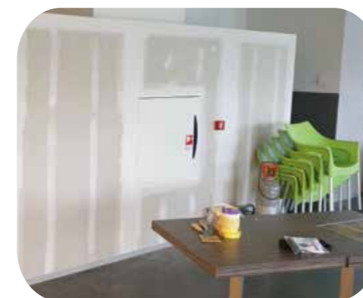
Het restaurant werd geschilderd en opgeknapt.

In dit jaarverslag beschrijven we de situatie in 2021. Op dat moment waren de gemeentes Langedijk en Heerhugowaard nog niet gefuseerd. Vandaar dat we de gemeentes in dit document nog apart benoemen, in plaats van de huidige naam Gemeente Dijk en Waard.